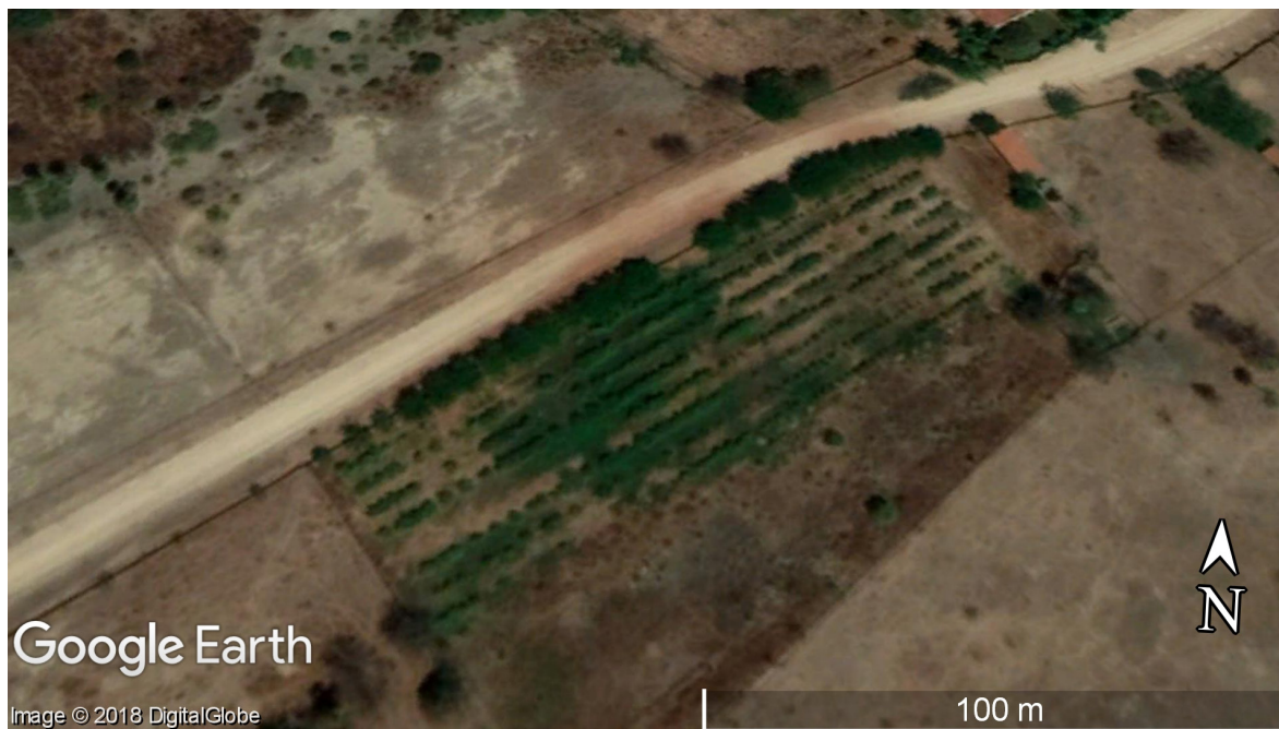
Figura 1. Área Experimental Nilson Mendonça, Sítio Pau Branco, Russas – CE, Brasil. Data da imagem: 29/12/2016.

O desenvolvimento vegetativo das combinações foi obtido a partir de avaliações biométricas realizadas aos 18, 24, 30 e 36 meses após o transplântio, nas quais mediam-se: a altura (h), do colo ao ápice; e os diâmetros da copa, nos sentidos entre plantas e entre linhas (Dl e Dr), utilizando trena milimetrada; e os diâmetros do enxerto e do porta-enxerto, tomados 10 cm abaixo e acima do ponto de enxertia das combinações, utilizando paquímetro digital